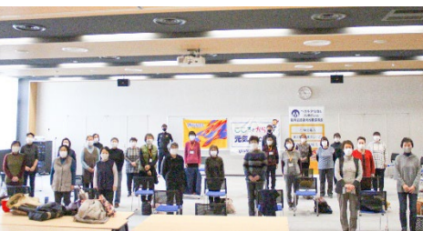
★ 11月13日(金) ささえあいセンター(住吉地区)