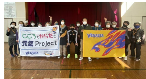
★ 11月11日(水) 渡波公民館(渡波地区)