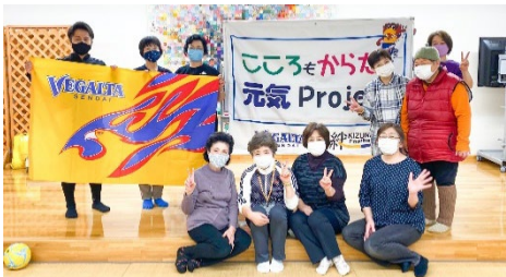
★ 10月8日(木) みなと荘(湊地区)