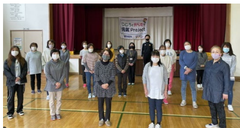
★ 11月11日(水) 稲井公民館(稲井地区)