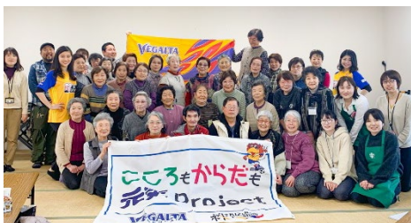
★ 2月12日(水) 新蛇田集会所