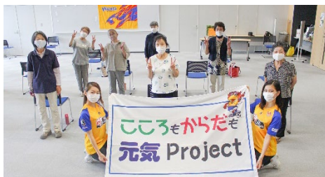
★ 9月16日(水) ささえあいセンター