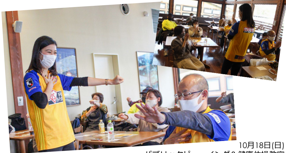
10月18日(日) パブリックビューイング&健康体操教室 いしのまき元気いちば