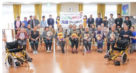
★ 11月26日(木) 春園苑 大谷デイサービスセンター