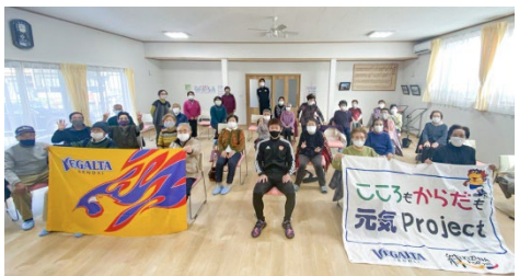
★ 11月27日(金) 住吉会館(住吉地区)