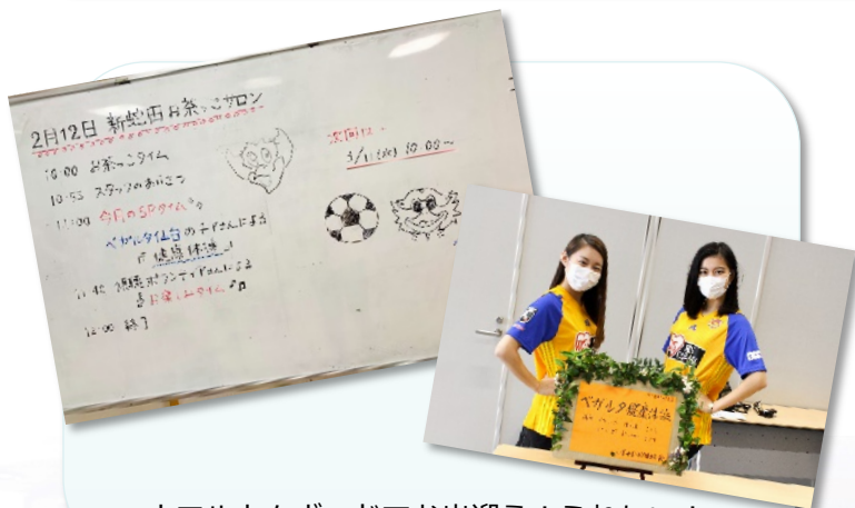
ウエルカムボードでお出迎え！うれしい！