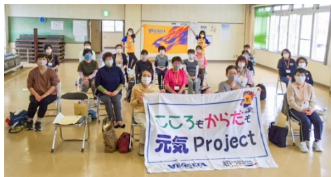
★ 10月8日(木) 釜会館(釜・大街道地区)