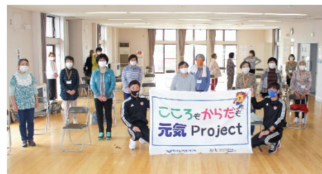
★ 10月7日(水) 向陽地区コミュニティセンター(蛇田地区)