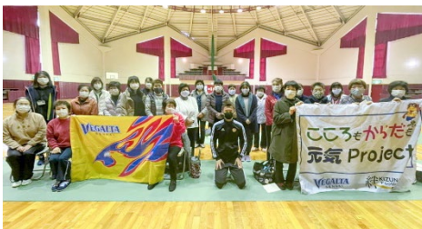
★ 12月1日(火) 桃生農業者センター(桃生地区)